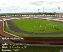
ESTÁDIO AGOSTINHO LIMA Apelo: Agostinho Lima Cidade: Sobradinho-DF Capacidade: 15.000

REQUERIMENTO: construção de mais quatro cabines ou estrutura provisória com pontos extras para mais quatro rádios. Cada ponto de transmissão deverá comportar no mínimo duas pessoas, além da necessidade de ao menos duas tomadas com energia, mesa ou bancada de apoio para equipamentos, cadeiras e ponto de internet.