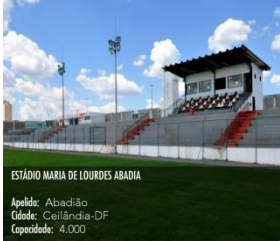
ESTÁDIO MARIA DE LOURDES ABADIA Apelo: Abadião Cidade: Ceilândia-DF Capacidade: 4.000

PARA A TEMPORADA 2019, A ABCD APRESENTA E REQUER DOS CLUBES, DA FFD E DAS ADMINISTRAÇÕES DOS ESTÁDIOS RELACIONADOS ABAIXO AS SEGUINTE PROVIDÊNCIAS: