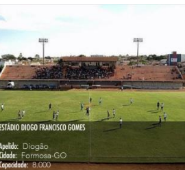
ESTÁDIO DIOGO FRANCISCO GOMES Apelo: Diogão Cidade: Formosa-GO Capacidade: 8.000

REQUERIMENTO – Conferir e, se for o caso, disponibilizar ao menos duas cadeiras em cada ponto de transmissão na tribuna de imprensa; limpar as bancadas nos dias de jogos; viabilizar instalação de internet nos pontos de transmissão.