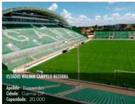
ESTÁDIO WALMIR CAMPELO BEZERRA Apelo: Bezerrão Cidade: Gama-DF Capacidade: 20.000

REQUERIMENTO: viabilizar estrutura para mais quatro cabines com pontos extras para quatro rádios. Cada ponto de transmissão deverá comportar no mínimo duas pessoas, além da necessidade de ao menos duas tomadas com energia, mesa ou bancada de apoio para equipamentos, cadeiras e ponto de internet. Retirar a grade que atrapalha a visão dos profissionais de imprensa que ficam na tribuna.